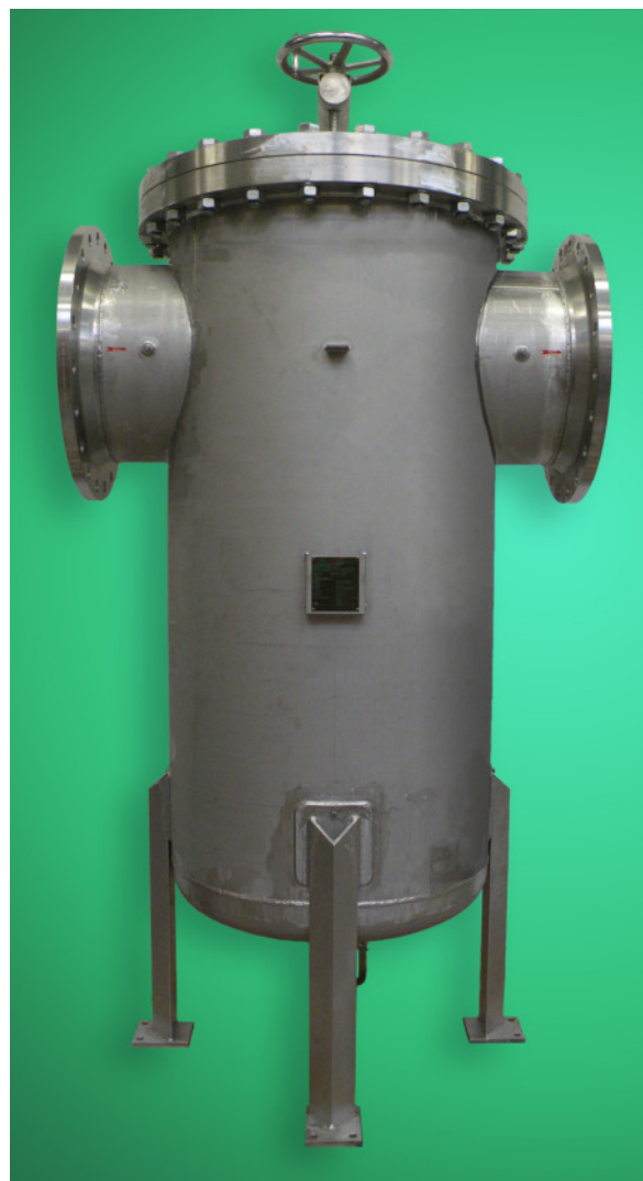
DELTA-SKB-50-I aus Edelstahl

Automobilindustrie, Chemische Industrie, Farben- und Lackindustrie, Kosmetikindustrie, Kunststoffindustrie, Lebensmittel- und Getränkeindustrie, Metall- und Stahlindustrie, Mineralölindustrie, Papierindustrie, Wasserversorgungsunternehmen etc.