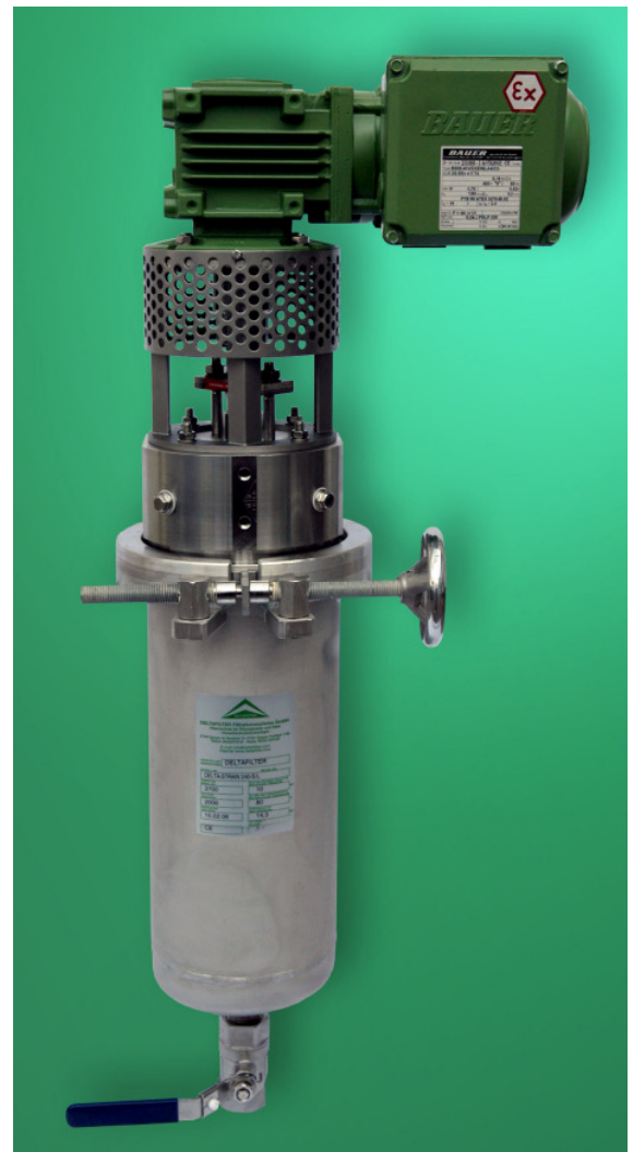
DELTA-STRAIN 240-S/L, 1.4571, 10 bar

Automobilindustrie Chemische Industrie Elektroindustrie Farben- und Lackindustrie Halbleiterindustrie Kosmetikindustrie Kunststoffindustrie Lebensmittel- und Getränkeindustrie Metall- und Stahlindustrie Mineralölindustrie Papierindustrie Pharmaindustrie Wasser- und Abwasserversorgungsunternehmen etc.