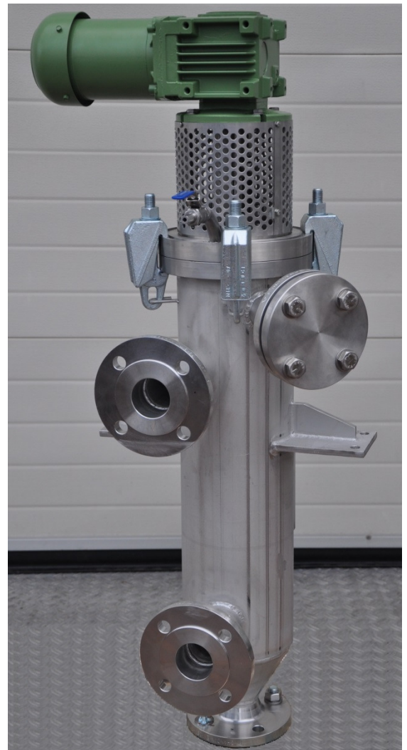
DELTA-STRAIN 200-RS, 1.4571, 10 bar

Industrie automobile Industrie chimique Industrie de l'électricité Industrie des peintures et vernis Industrie des semi-conducteurs Industrie cosmétique Industrie plastique Industrie agro-alimentaire Industrie de l'acier et du métal Industrie pétrolière Industrie du papier Industrie pharmaceutique Sociétés d'approvisionnement et de traitement des eaux, etc.